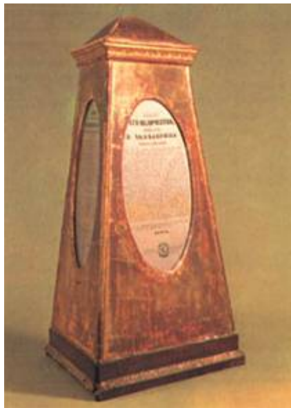
Зерцало из суднице царске Русије,