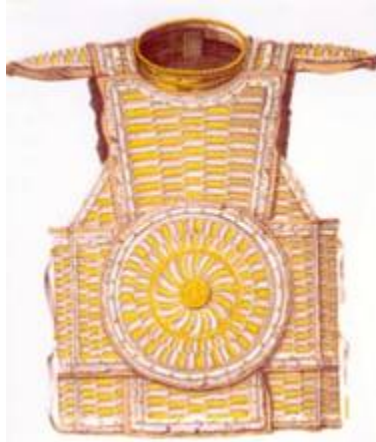
Древни руски средњевековни оклоп зерцало

На просторима Русије, али и на просторима Бутмира (сада Босна и Херцеговина), очувао се из прехришћанских времена оклоп који се и у Персији, па и у Ирану, називао зерцало како у целини тако и у деловима – који су ништа друго до знак Коло, такво какво је и у Лепенском Виру, какво је и у Мировареној палати Патријаршијског дворца московског Кремља.